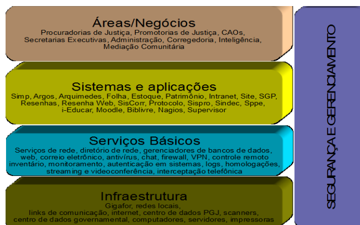
Arquitetura de TI do MPCE

A infraestrutura de TI do MPCE envolve computadores, notebooks, impressoras, scanners, redes locais, links de comunicação de dados, servidores, no-breaks e estabilizadores de energia. Este aparato, juntamente os serviços básicos e sistemas formam a arquitetura de TI do MPCE que está representada no diagrama abaixo.